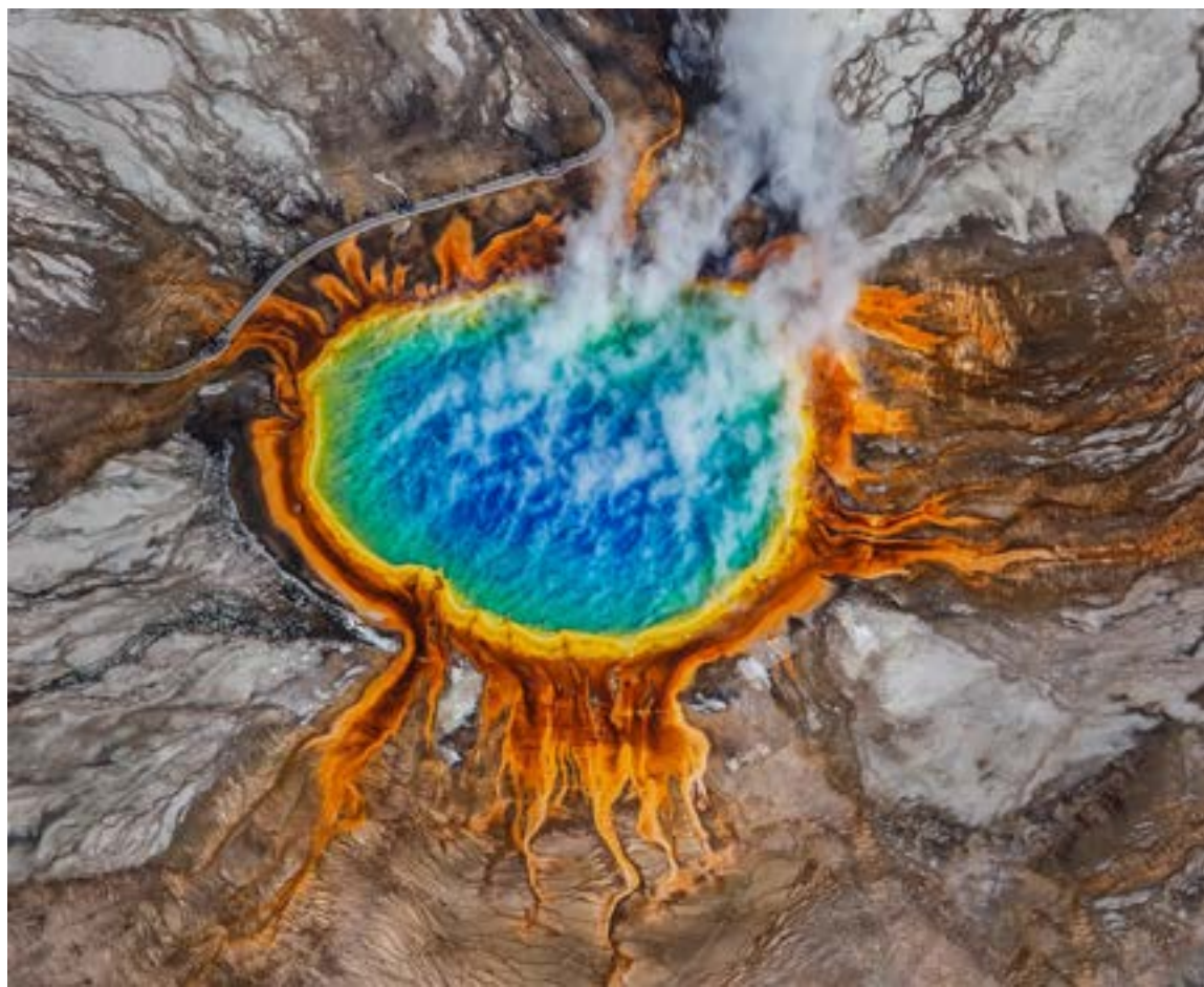
El supervolcán de Yellowstone

A pesar de que la historia del volcán sugiere ciclos eruptivos de unos 600.000 años en promedio, los expertos enfatizan que la geología no obedece a un reloj.