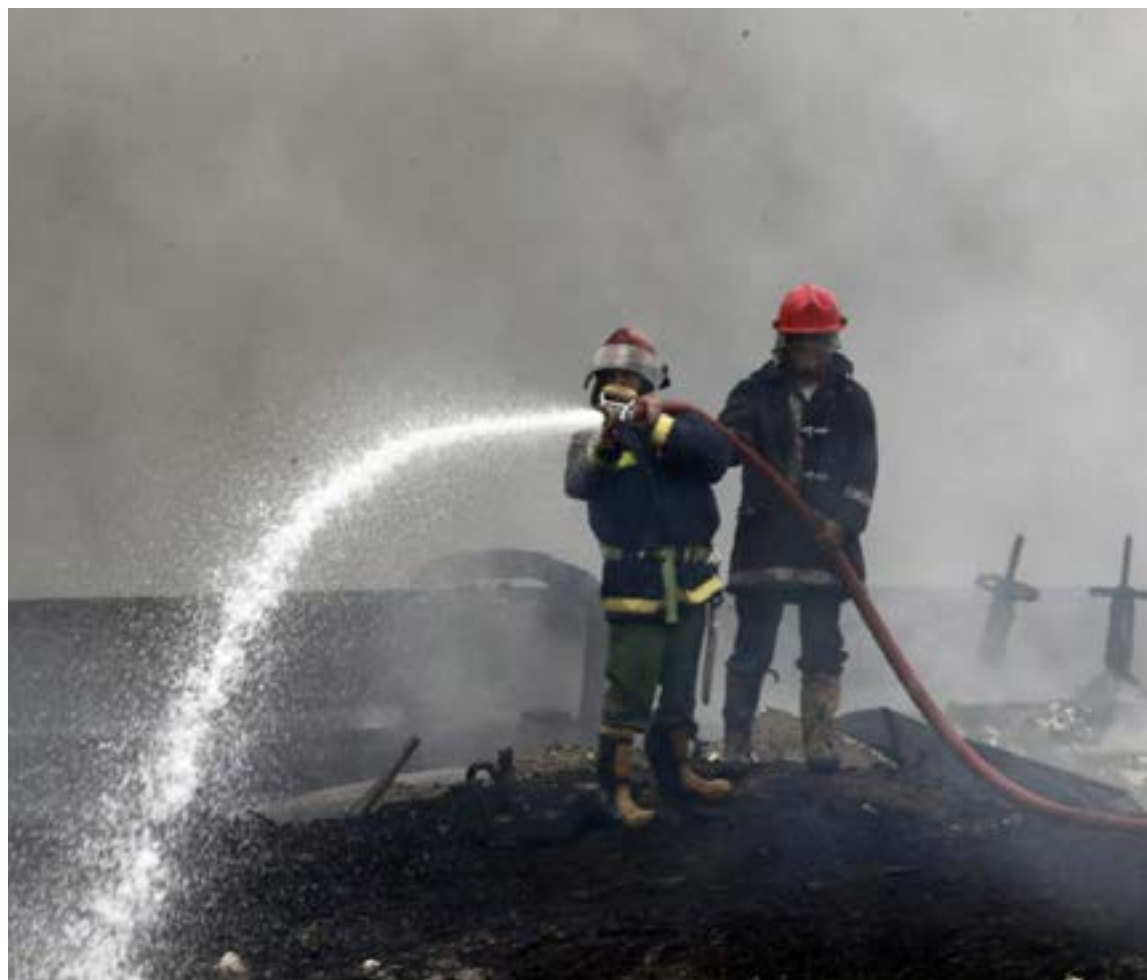
Esfuerzo y trabajo la constancia de los bomberos

Sistemáticamente desarrollan ejercicios estratégicos de enfrentamientos en situaciones de emergencia.