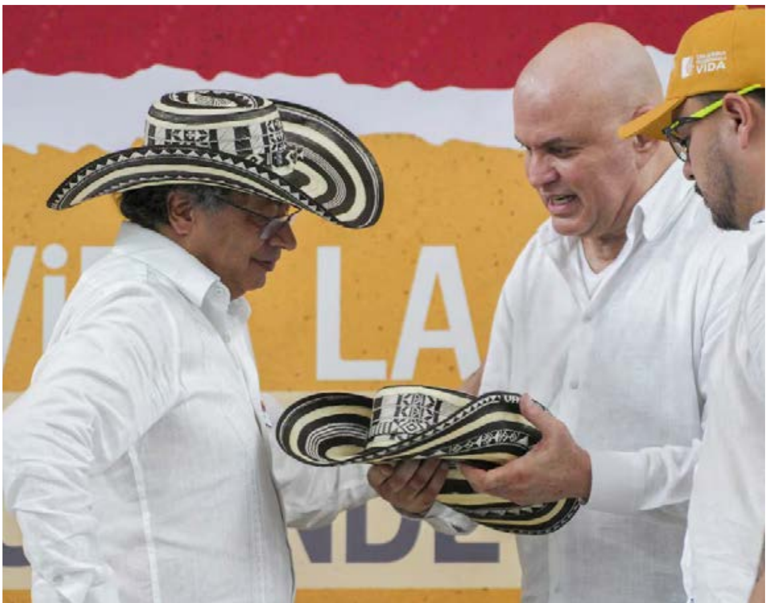
El propio presidente Petro inició los contactos con el jefe del Paramilitarismo Salvatore Mancuso.

Gestores de paz para que revelen sus com gestores de paz para revelar los políticos que impulsaron el paramilitarismo.