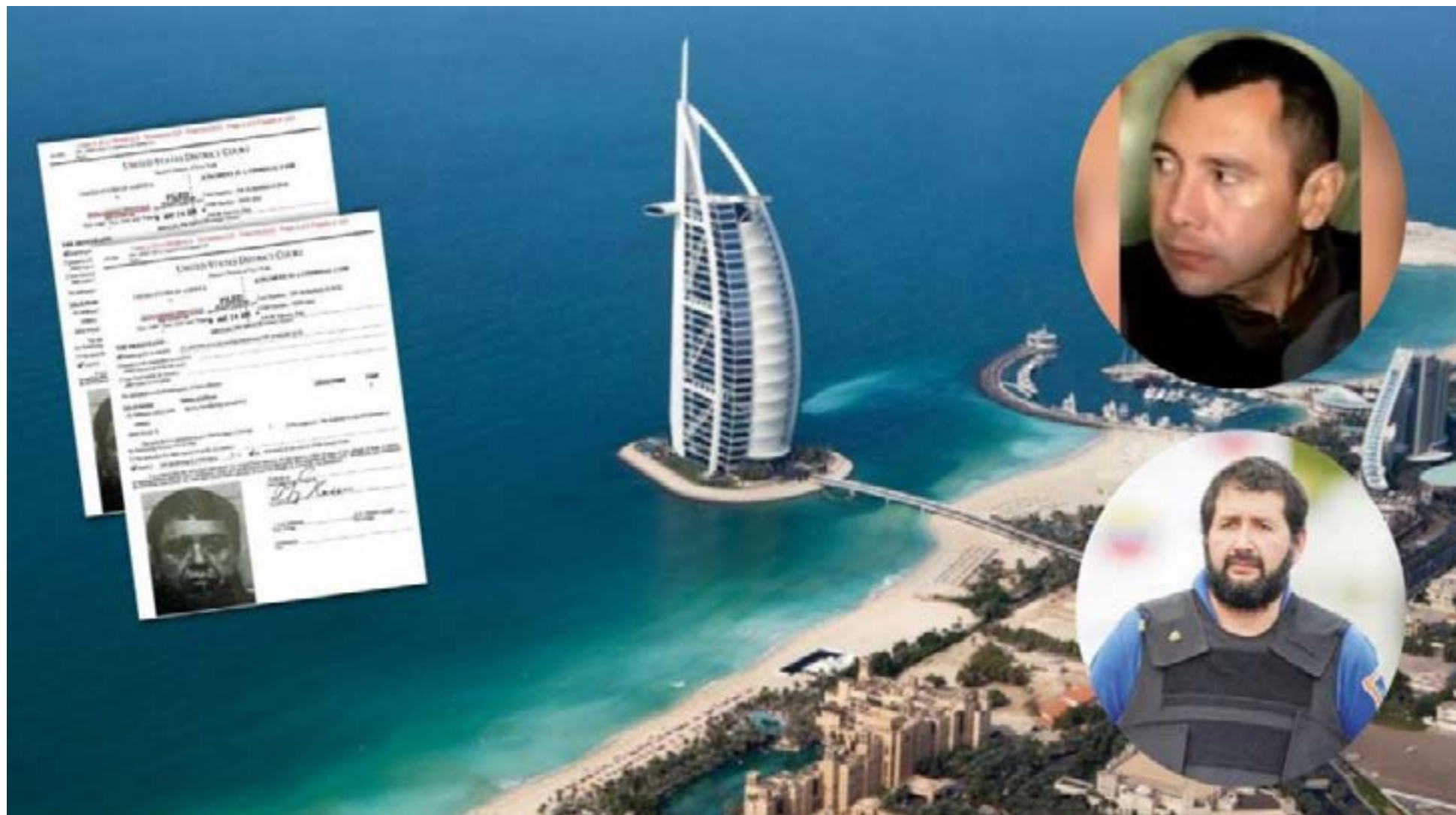
La boda, el millonario salvadoreño y los capos colombianos detrás de la 'junta directiva de la mafia' que se esconde en Dubái

ropa, especialmente de hachís, pero también de cocaína proveniente de Sudamérica. La conexión de mafias neerlandesas-marroquíes (Mocro Maffia) con organizaciones colombianas como el Clan del Golfo evidencia la interconexión de estas redes. La cocaína colombiana llega a Marruecos para ser redistribuida hacia el continente europeo, donde los precios por kilo son significativamente más altos que en otros mercados.