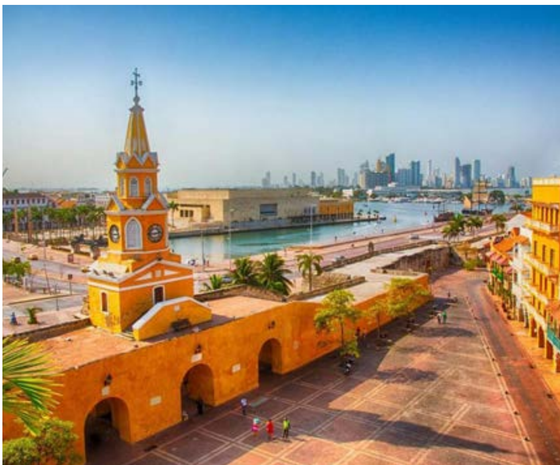
Colombia segundo país con más ingresos en Latinoamérica por turismo

to de vista de la positividad de lo que estamos realizando en estos dos años» y resaltó los avances que ello representa en términos de equidad, pues en solo turismo hay cerca de 115 mil unidades empresariales, mientras las de carbón y petróleo se pueden contar con los dedos de la mano.