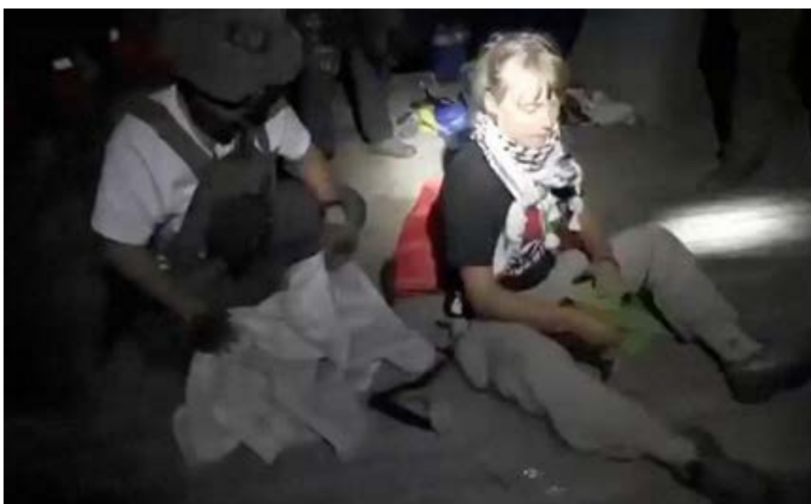
Secuestro masivo de Israel en aguas internacionales de los activistas que llegan ayuda a los habitantes de Gaza

Ambas son reconocidas defensoras de derechos humanos, exiliadas de Colombia tras recibir amenazas durante el Estallido Social de 2021.