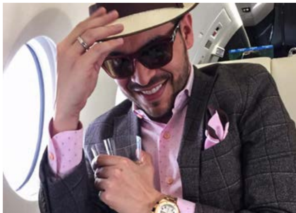
Abelardo de la Espriella

Como van las cosas en este país pareceríamos que estamos condenados a escoger en las elecciones del año próximo entre Abelardo de la Espriella y Daniel Quintero.