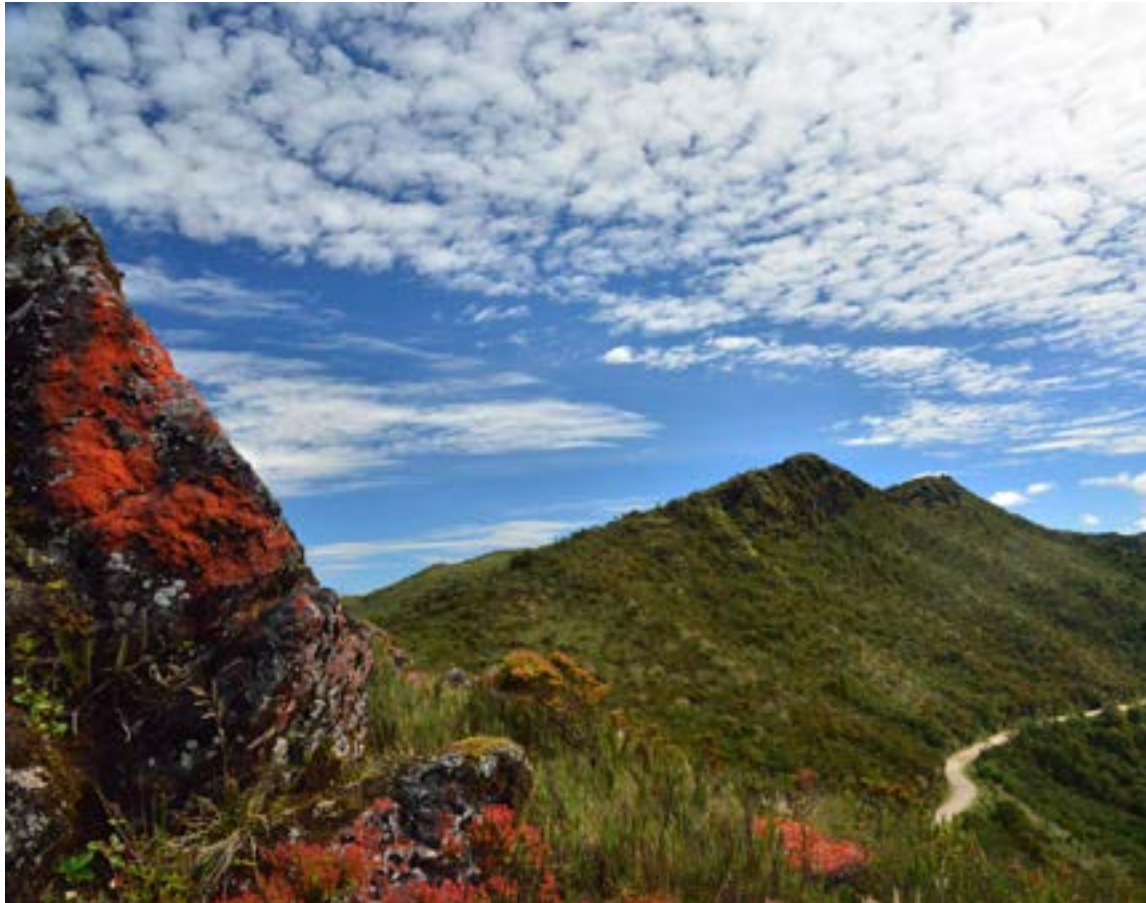
Colombia «El país de la belleza», pronto liderará el turismo en el continente americano.

Sostuvo, asimismo, que, si el balance se hiciera no en dólares, sino en trabajo, «todavía es mucho más contundente, desde el pun-