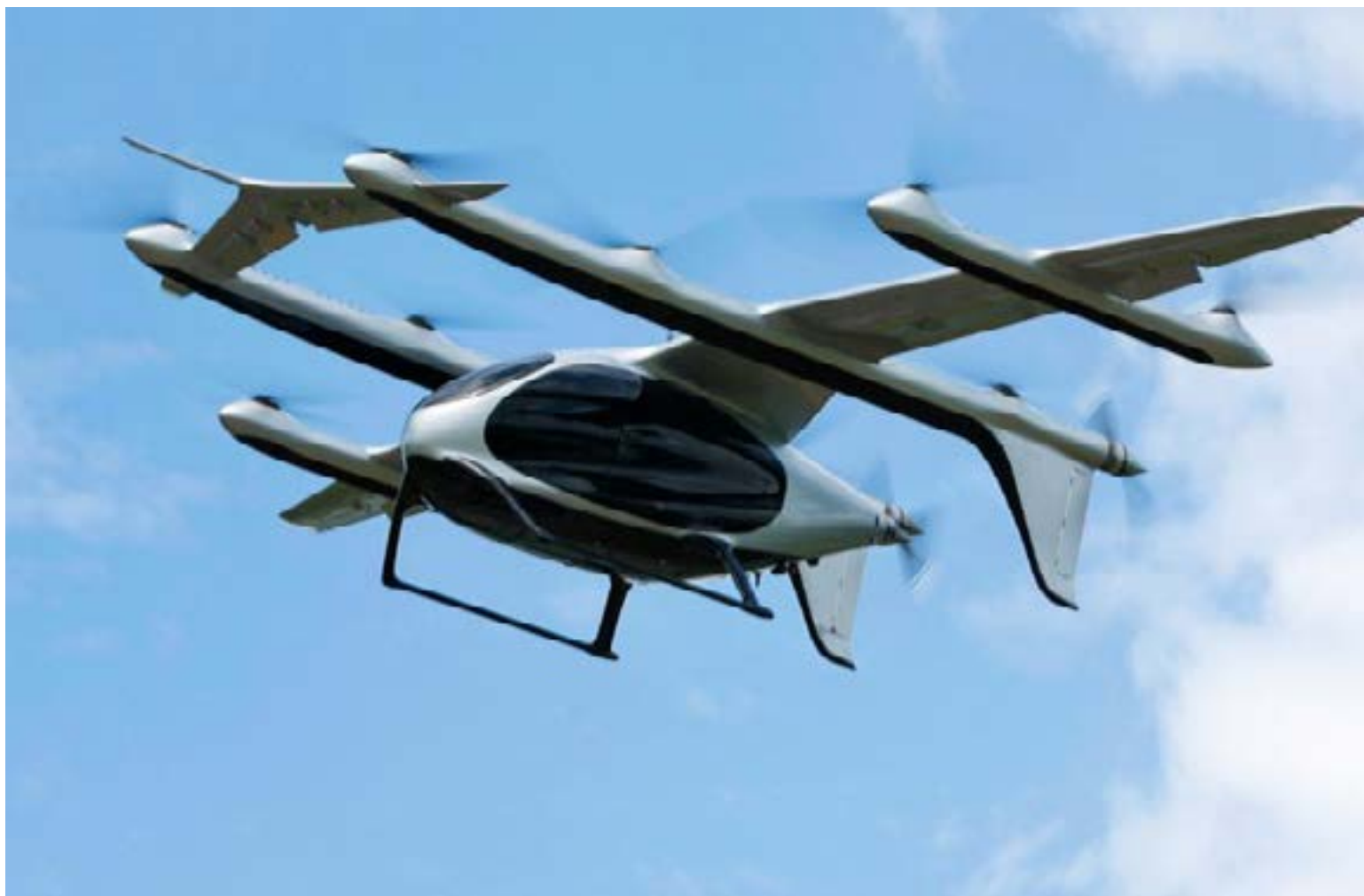
Este nuevo dron de China podría cambiar la historia de la guerra naval. Le permite hacer despegues y aterrizajes de manera vertical desde buques de guerra comunes.