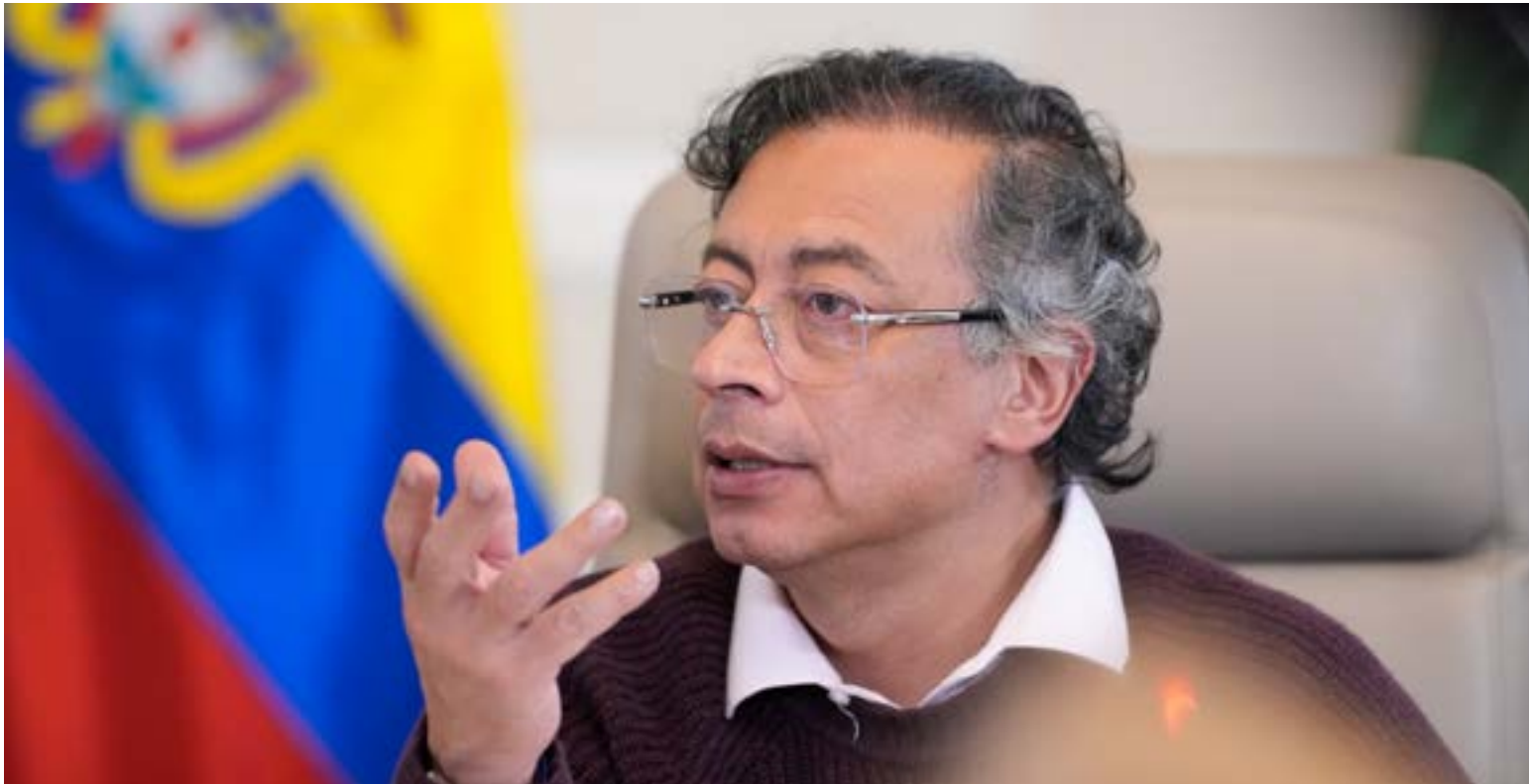
Gustavo Petro Urrego, presidente de los colombianos.