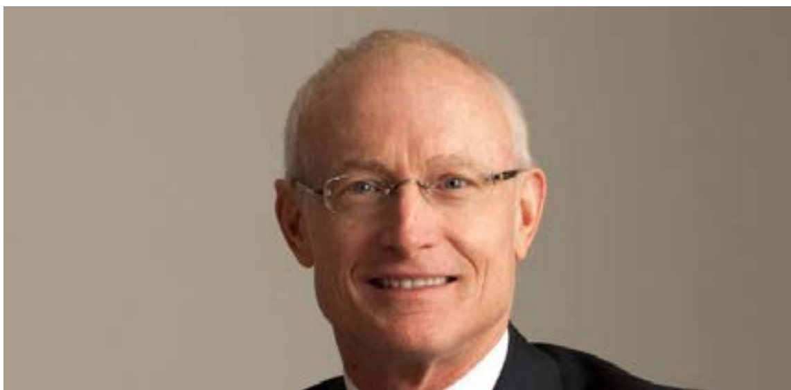
Michael E. Porter

Una de las personas a nivel mundial que más ha investigado y escrito sobre estrategia empresarial es el Dr. Michael Porter, profesor emérito de la Universidad de