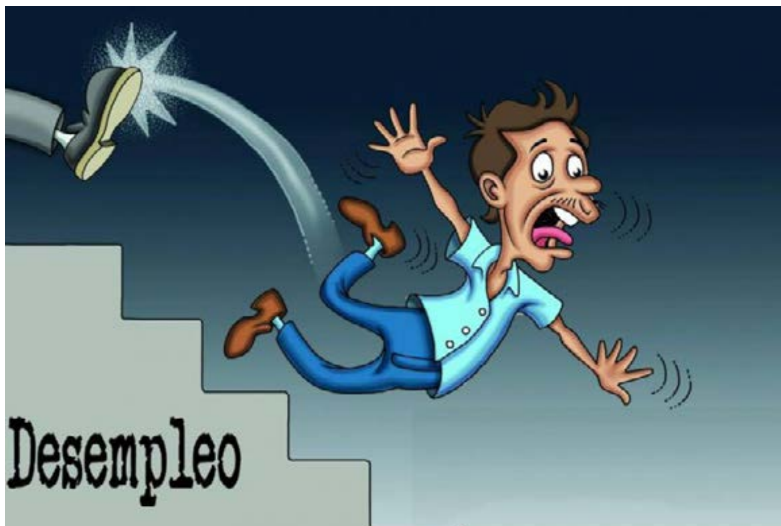
En caída libre

Según los datos del DANE, este alentador panorama laboral se ha visto impulsado por el notable desempeño de sectores clave de la economía colombiana. El sector agropecuario continúa consolidándose como uno de los principales motores de crecimiento, reflejándose también en su significativa contribución a la creación de empleo, con la adición de 381.000 nuevos puestos de trabajo. Asimismo, el turismo ha experimentado un crecimiento de dos dígitos, y la industria no pe-