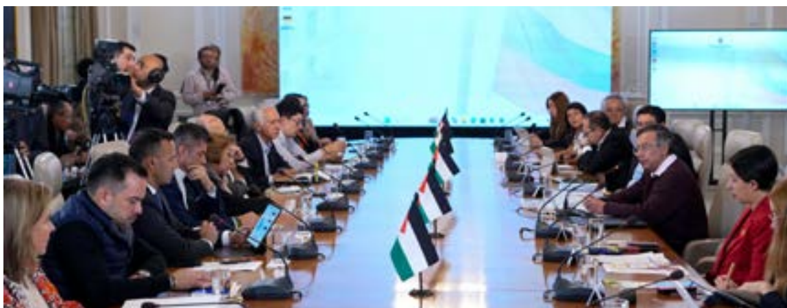
En el último Consejo de Ministros fue abordado el tema de diversos sectores empezando por la oposición en el desprestigio del actual gobierno.

La disputa se encendió en torno a un mapa publicado por The Economist, que sugería una presencia e influencia de grupos armados ilegales en más del 70 por ciento del territorio colombiano. La